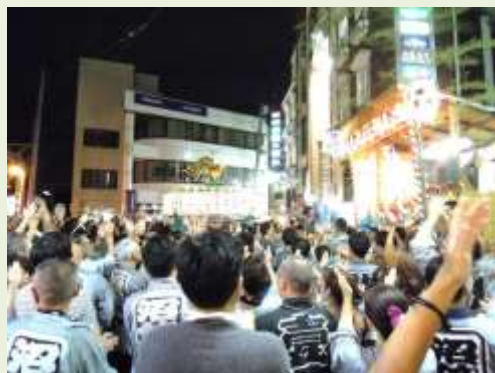
沼袋氷川神社例大祭 8月23日

(毎週火・木曜 午前11～午後3時) 「これからも元気に暮らすためのヒント(お口編)」 日時：9/16(火) 午後12時15分～1時 講師：北部すこやか福祉センター歯科衛生士