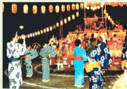
納涼盆踊り大会 8月25日