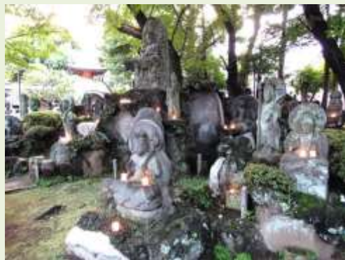
百観音献灯会 7月27日