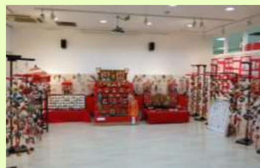
素晴らしさにびっくりボン！ひな飾り展