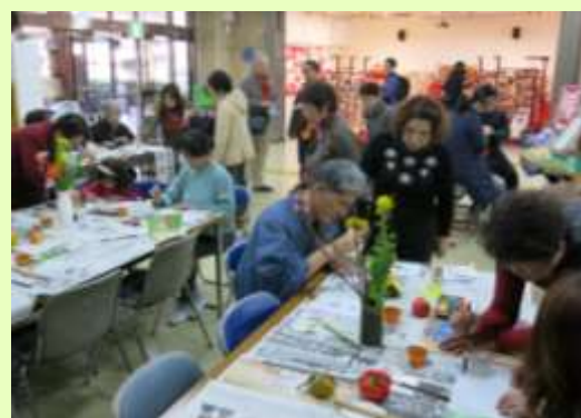
いくつになってもうれしい ふれあい♡ひなまつり