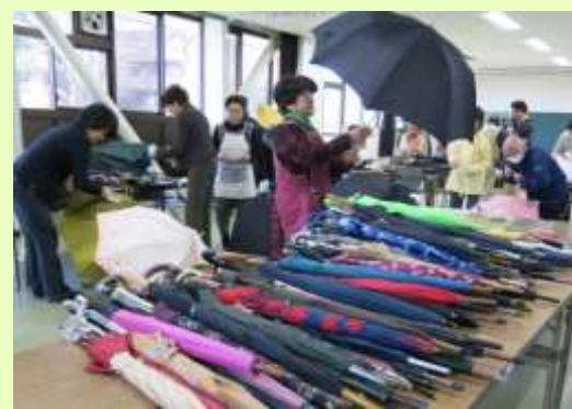
皆さんに使っていただくために！ 沼袋アンブレラハウスの会 1日体験ボランティア