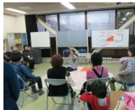
「きんぎょの会」子どものクツ選び講座 (みんなといっしょ！)