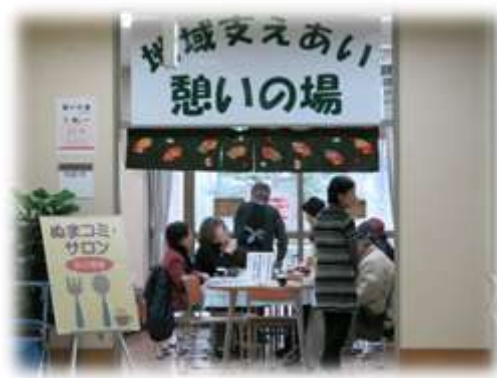
2/23(火) ぬまコミ・サロン

毎週 火曜日・木曜日 午前11時～午後3時 ※変更の場合あり 会場：高齢者集会所 対象：中野区在住・60歳以上の方 参加費：50～150円（実費） 詳細は区民活動センター内に掲示の ぬまコミ・サロンカレンダーをご覧ください