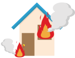
警視庁 HP 内「避難するときは」参照

「ごめんじですか63」 「じつは怖い！通電火災」 通電火災とは地震発生時に停電し、数時間から数日以降に電気が復旧した時に破損した電化製品などから発生する火災です。避難する時に電気のブレーカーを落とすだけで二次災害は防げます。