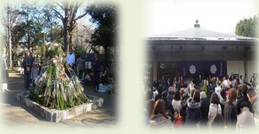
お正月の風物詩どんど焼き 明治寺（百観音）の豆まき