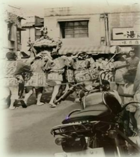
沼袋氷川神社例大祭の風景