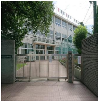
緑野中学校 正門前

発行：沼袋区民活動センター運営委員会 住所：中野区沼袋2-40-18 TEL: 03-3389-4572 FAX: 03-3389-4635 Eメール: info@nakano-numabukuro.gr.jp