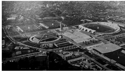
駒沢オリンピック公園（1964年度）

会期：7/10（火）～8/10（金） 1964年の東京オリンピックと、開催されなかった1940年の東京オリンピックと中野との関連を紹介します。