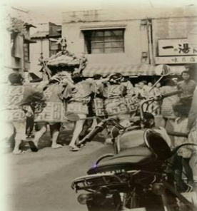
沼袋氷川神社例大祭の風景