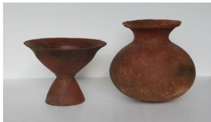
区内の遺跡から発掘された土器

会期：7/21（土）～8/31（金） 遺跡から発掘された土器や石器などを見て、大昔の中野の様子を調べてみよう。